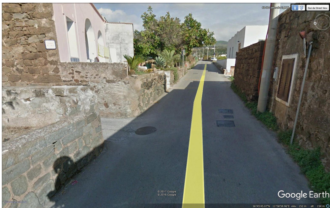
Fig. 3: Innesto sulla strada comunale Scauri – Rekale