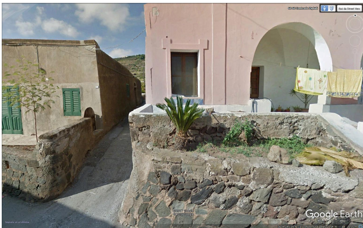
Fig. 4: Innesto sulla strada comunale Scauri – Rekale