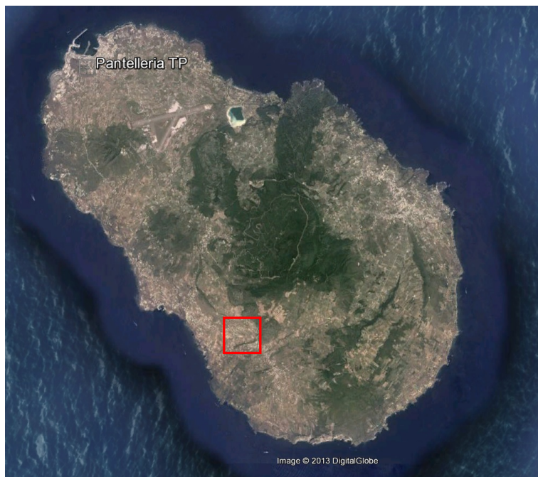
Fig. 1: Foto dal satellite: Isola di Pantelleria

Le attività connesse alle operazioni di coordinamento e di progettazione, sono assegnate al sottoscritto Ing. Girolamo Busetta, giusta determina N°106/II set. Del 03.03.2017.